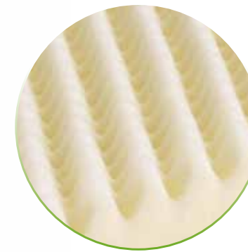
Noppenprofil für optimale Anpassung