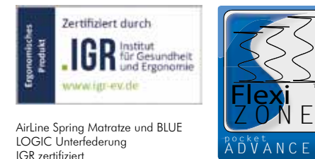
AirLine Spring Matratze und BLUE LOGIC Unterfederung IGR zertifiziert